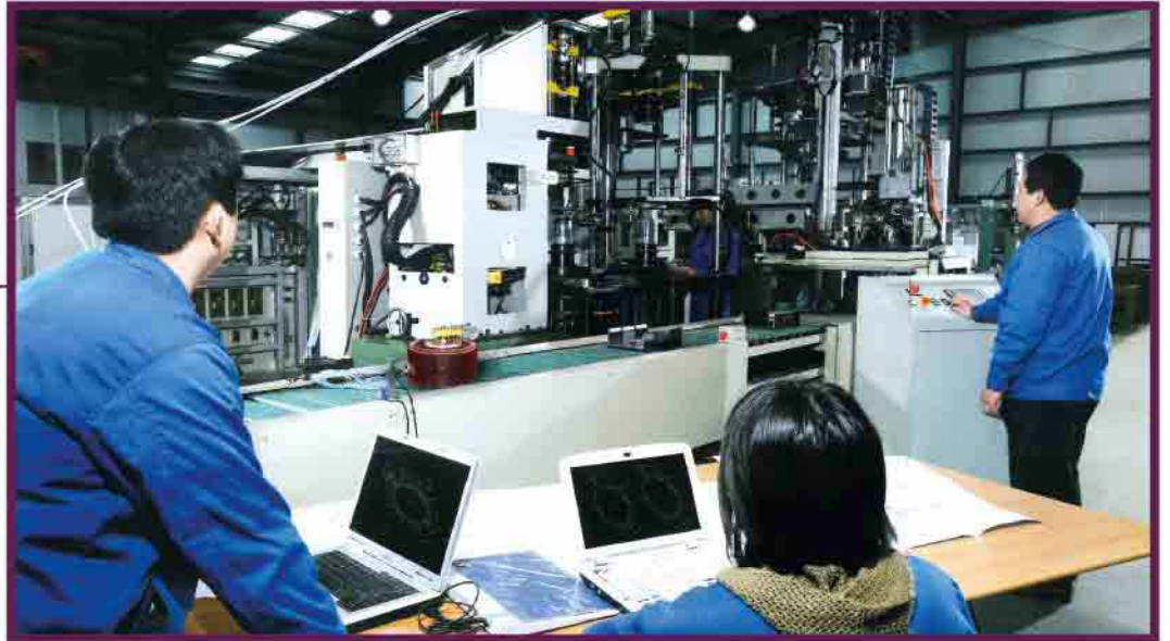
جمهوری سخت کوشی